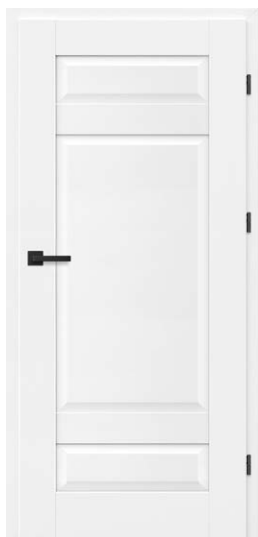
FRESTO 2 BIAŁY PREMIUM 771,54 zł netto / 949 zł brutto