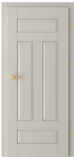
FRESTO 5 CAPPUCCINO ST CPL 771,54 zł netto / 949 zł brutto