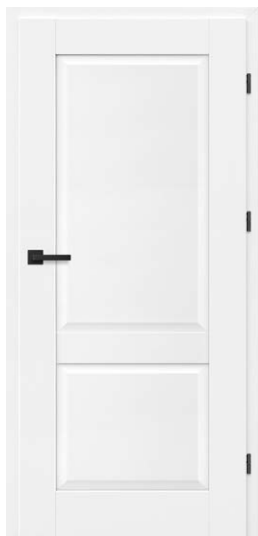
FRESTO 3 BIAŁY PREMIUM 771,54 zł netto / 949 zł brutto