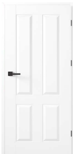
FRESTO 4 BIAŁY PREMIUM 771,54 zł netto / 949 zł brutto