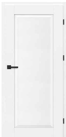
FRESTO 1 BIAŁY PREMIUM 771,54 zł netto / 949 zł brutto