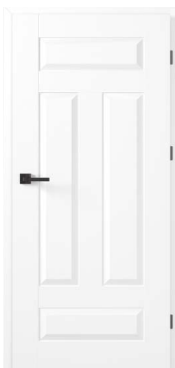
FRESTO 5 BIAŁY PREMIUM 771,54 zł netto / 949 zł brutto