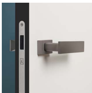
CZARNY DRZWI BEZPRZYLGOWE