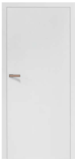
MODUS+ 10 BP BIAŁA MAT 649,59 zł netto / 799 zł brutto