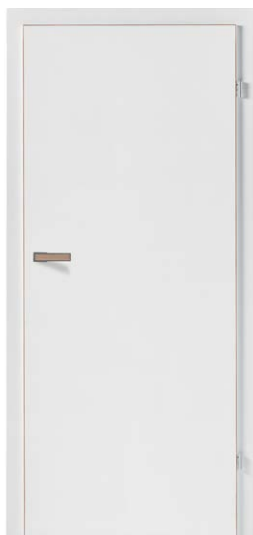
MODUS+ 10 PROSTA BIAŁA MAT 560,16 zł netto / 689 zł brutto