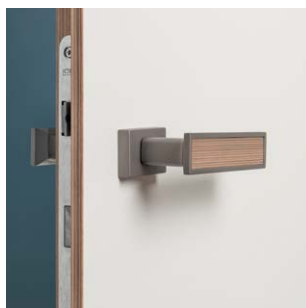
SKLEJKA DRZWI PRZYLGOWE