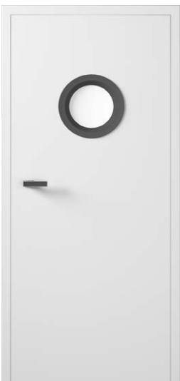
MODUS+ 20 BP BIAŁA MAT 1072,36 zł netto / 1319 zł brutto