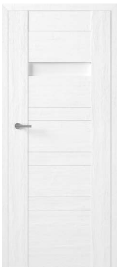
PREZZO 01 SOSNA BIAŁA 836,59 zł netto / 1029 zł brutto