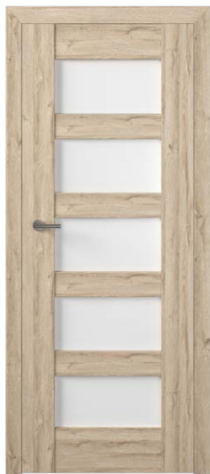
PREZZO 05 DĄB VINTAGE 771,54 zł netto / 949 zł brutto