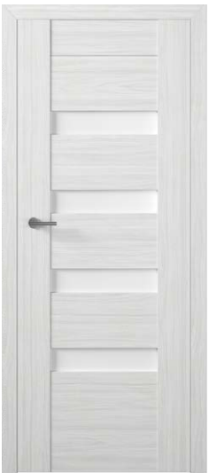
PREZZO 02 WIAŻ SYBERYJSKI 771,54 zł netto / 949 zł brutto