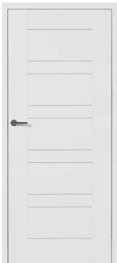
PREZZO 03 BIAŁA MAT 836,59 zł netto / 1029 zł brutto