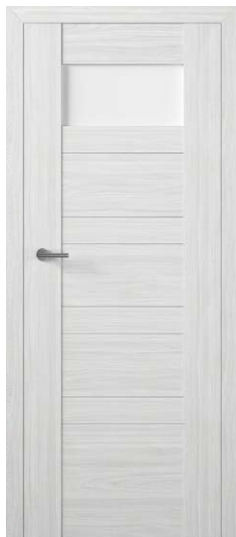
PREZZO 04 WIAŻ SYBERYJSKI 836,59 zł netto / 1029 zł brutto